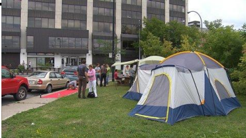
Des étudiants campent devant les bureaux du ministère de l'Éducation, à Montréal.