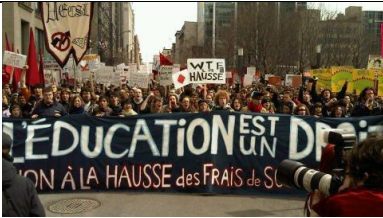
Manifestation d'étudiants au centre-ville de Montréal (archives)

Les étudiants collégiaux et universitaires du Québec feront monter la pression cet automne afin de faire reculer le gouvernement Charest sur son intention de hausser les droits de scolarité. La Fédération étudiante collégiale du Québec (FECQ) et la Fédération étudiante universitaire du Québec (FEUQ) ont annoncé leurs couleurs dimanche, promettant des actions qui s'intensifieront jusqu'au 10 novembre, date où se tiendra à Montréal une grande manifestation étudiante. D'ici là, les fédérations comptent être présentes sur les différents campus pour informer les