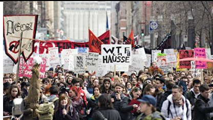
Manifestation étudiante à Montréal contre la hausse des droits de scolarité (archives)

Alors que la rentrée scolaire approche, les fédérations étudiantes collégiale et universitaire font savoir qu'elles vont augmenter leurs moyens de pression contre la hausse des frais de scolarité annoncée par Québec.