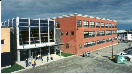
Université du Québec en Abitibi-Témiscamingue Une étude de la Fédération étudiante universitaire du Québec (FEUQ) réalisée en 2009-2010 montre que les étudiants de l'Université du