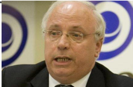
Le président de la Centrale des syndicats du Québec, Réjean Parent.