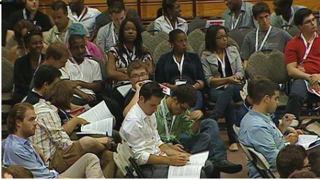
Des jeunes libéraux en congrès