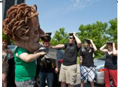
Le campement étudiant devant le Ministère de l'Éducation par la Fédération étudiante collégiale du Québec (FECQ), en juin dernier.