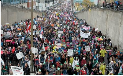
Le 10 novembre dernier, une manifestation monstre était organisée à Montréal pour protester contre la hausse des droits de scolarité. Un sondage Senergis-Le Devoir montre toutefois qu'une majorité de Québécois approuve cette hausse.