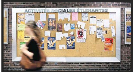
À l'heure actuelle, un étudiant peut facilement obtenir une marge de 10 000$ par année. STÉPHANIE GRAMMOND

En cette rentrée scolaire, les étudiants dénoncent les pratiques parfois racoleuses des institutions financières : sollicitation sur les campus, cadeaux pour encourager les jeunes à remplir une demande de carte de crédit, limites de crédit exagérées, publicités trompeuses... La Fédération étudiante universitaire du Québec trace un portrait inquiétant du crédit étudiant, dans une étude fouillée de près de 200 pages obtenue en exclusivité par La Presse. La banque est installée au coeur de la station de métro Berri-UQAM. En vedette sur des panneaux-réclame, des réductions de 5% à 10% sur les titres de transport pour les détenteurs de carte