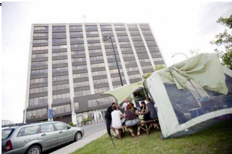
Des étudiants campent devant les bureaux du ministère de l'Éducation à Montréal pour protester contre la hausse des frais de scolarité au Québec.

Valérie Simard et Paul Journet, La Presse