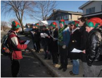
Des étudiants ont entonné quelques cantiques irrévérrencieux devant la résidence du nord de

Montréal de la ministre de l'Éducation Line Beauchamp, mardi matin.