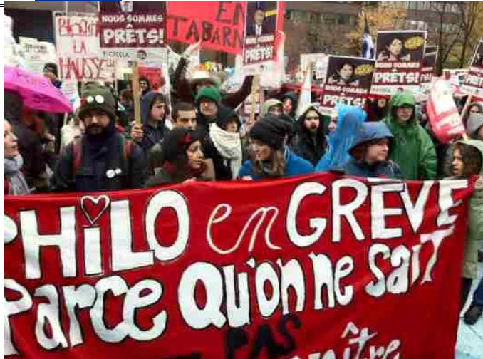
Students demonstrate at Place Emilie Gamelin in Montreal against higher tuition fees

Re: "Surprise! Low tuition fees are a benefit – to the rich" (Opinion, Nov. 10).