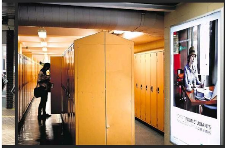
Les institutions tentent de rejoindre directement les jeunes sur les campus, comme ici au Cégep du Vieux-Montréal.