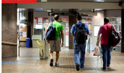
Le nombre d'étudiants qui a atteint le niveau maximal annuel d'endettement prévu par la loi, de même que de ceux qui font faillite est en hausse au Québec.