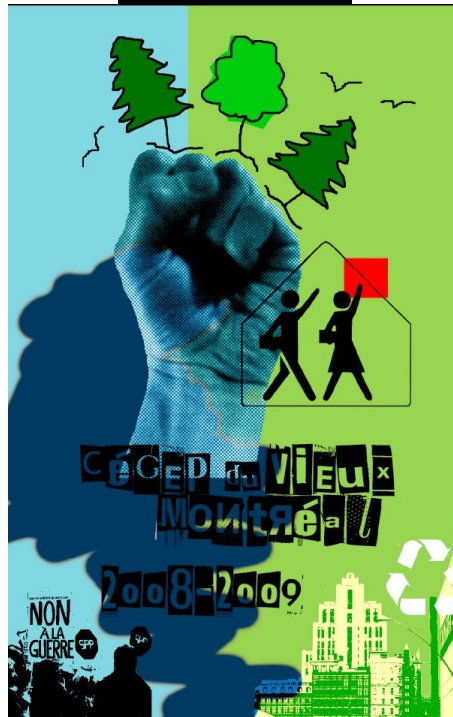
Projet #4 (Recto-Verso)