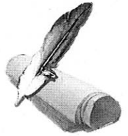
TABLE DE VENTE DU 28 AVRIL AU 9 MAI